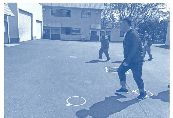
ライフキネティック