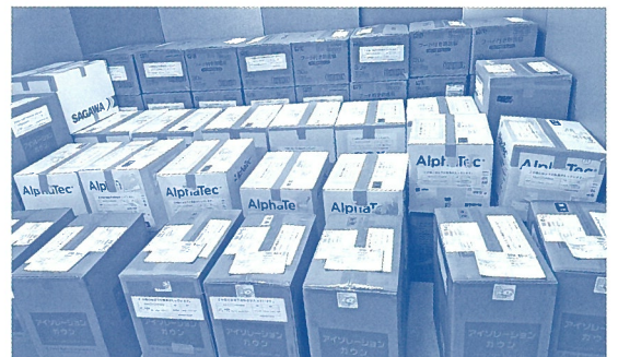
緊急配布用衛生用品（8地方会分）

以上、令和2年4月から12月までの協会の動きを振り返ってみましたが、この9ヵ月間、道内は大きな災害こそなかったものの、目に見えない感染症の得体の知れない怖さを思い知らされました。この間、感染者が出た施設職員の方々、他の施設の支援に従事された方々、この他、利用者の感染防止に細心の対応を続けてこられた、皆様の懸命のご尽力、ご奮闘に改めて感謝を申し上げ、令和3年の協会の発展及び会員施設・事業所の利用者・職員の皆様が健やかに過ごされますことを心から祈念し、ご報告とさせていただきます。