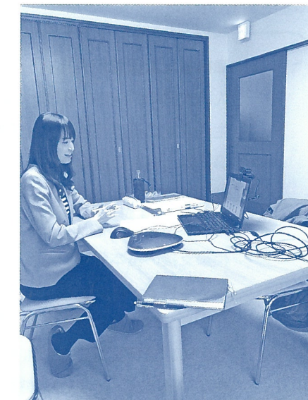
オンライン就職説明会