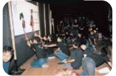
シルエットサークル