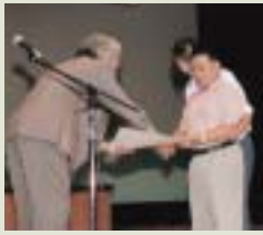
豊浦やまと更生園 ビッグ・バラーズ

まさか大賞が取れるなんて思ってもいませんでした。毎日の練習の成果が出たのかな？頑張ってた。うれしい。名前がよばれた時は、びっくりして涙がとまりませんでした。これからもみんなの協力をもらって頑張ろうと決意を新たにしました。ありがとうございました。