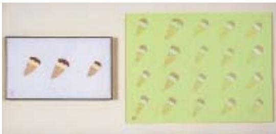
ソフトクリーム / 前多道子・安藤由有子