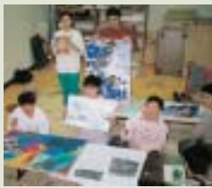
あかとき学園 絵画クラブ

ヤッター! 3賞独占なんて思いもなかったよ。描くの好きだよ! イヤになんかならないよ! いろいろ賞もらえて何だか不思議な気持ちなんだよねえ! 私たちの絵を観ると、みんな元気が出るよ! 明日も絵、描くよ!