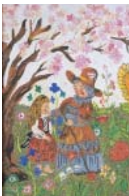
おはなし / 落合早苗