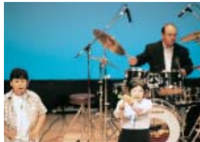
ハローブラザーズ ミニ