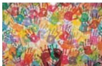
夢 / 小松敏昭