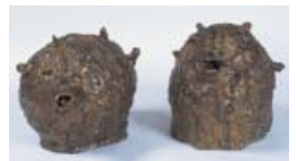
顔 / 日當 学