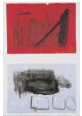
ジャンプ台・車 / 小原宏樹