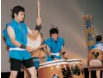
TEAM 勇(チーム イサミ)