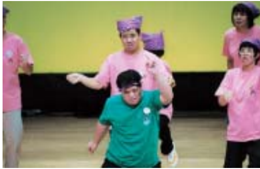
勇人(ハヤト)ダンサーズ