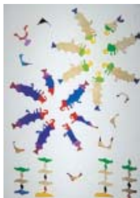
ファイヤー・ダンス / 河村朋靖