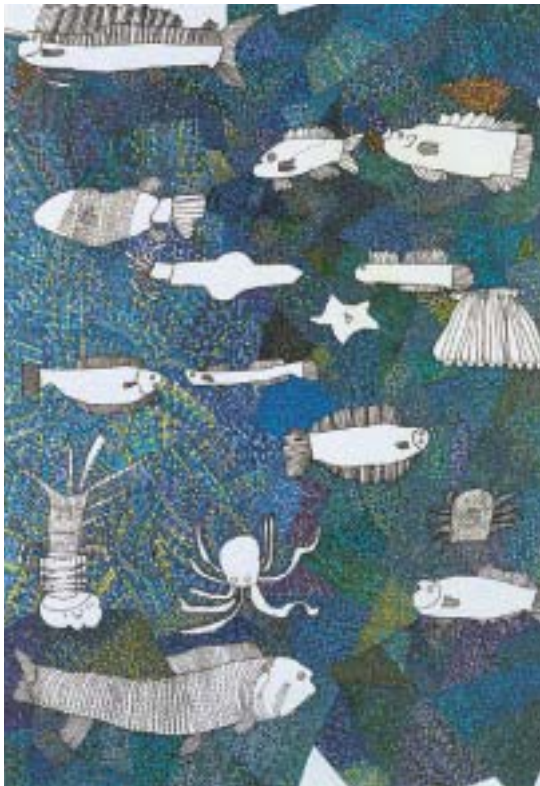
海の中 / 得能サチ子