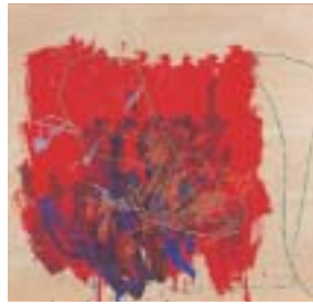
作品No.9 / 白川 薫