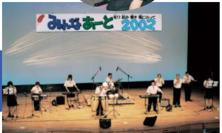
ステージ部門 みんなあーと大賞 「ビッグ・バラーズ」