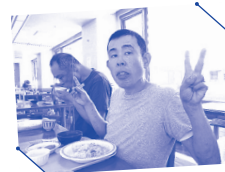
七夕行事食 の写真