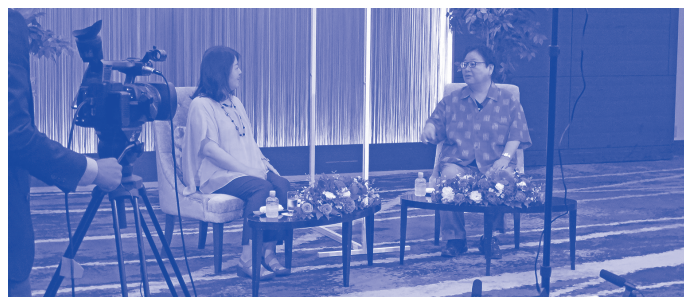
分科会セッション2 対談

コロナ禍が続く中で本研修会も、オンライン配信という最近のスタンダードスタイルでしたが、おかげさまで全国から600名超のお申込みをいただきました。そのうち道内からは154名ということを見ると、日本最北開催にも拘わらず全国津々浦々から多くの皆様にご視聴いただいたものと実感するところです。