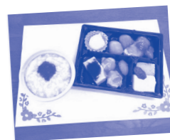
◀紅白幕の内弁当 (ソフト食)