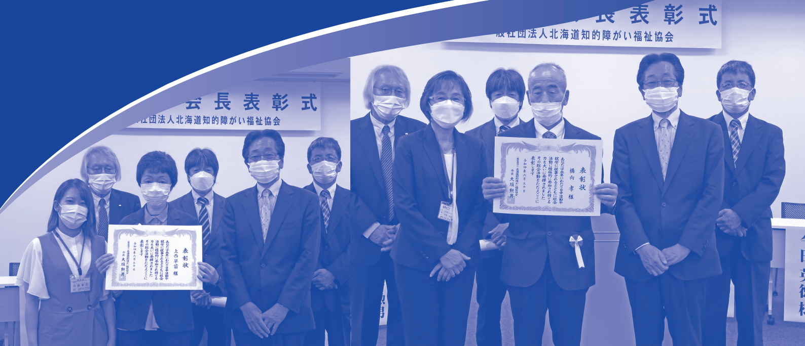
令和4年度 会長表彰式 一般社団法人北海道知的障がい福祉協会