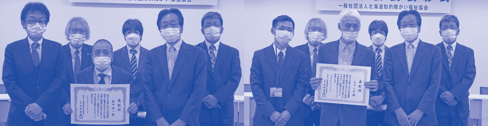
令和4年度北海道知的障がい福祉協会会長表彰 受賞者のみなさま（総合活動者）