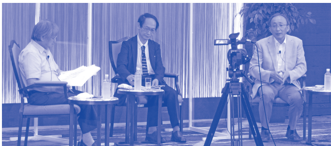
分科会セッション1 鼎談

分科会セッション1は地域支援レジェンドお三方による、まさに「故きを温ねて新しきを知る」ことが出来た鼎談ではなかったでしょうか。グループホーム創世期から障がい者福祉をけん引して来られた皆さんが語る「展望」に、課題を感じるとともに大きな期待を抱くことが出来ました。